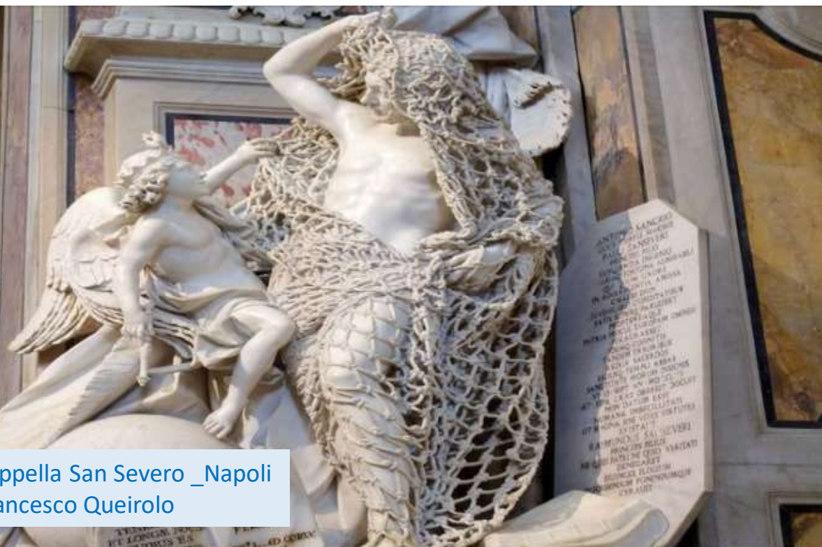
Chiesa di San Severo _Napoli Francesco Queirolo